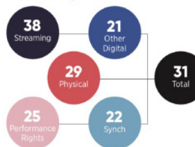
World Ranking 2018